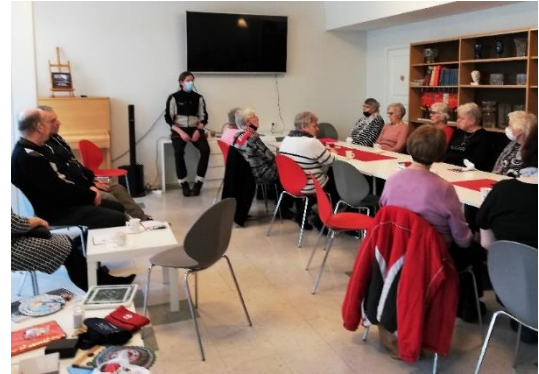
Seniorikahvilan osanottajia 14.3.2022