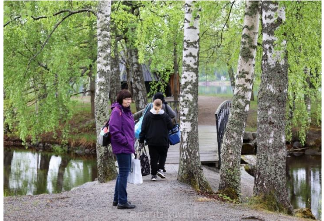
Kevätretkellä Aulangon tekosaarilla.